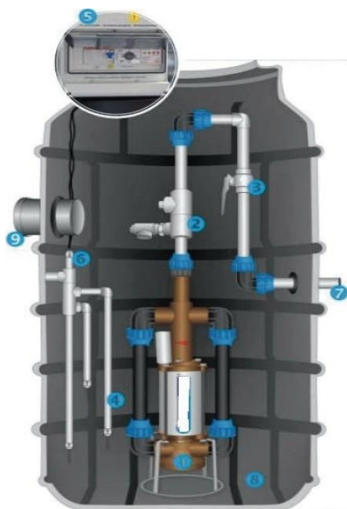
SCHÉMA ČERPAČÍ JÍMKY